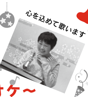
心を込めて歌います