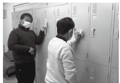
きれいになったかな?