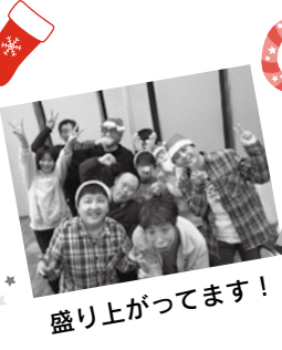
盛り上がってます!