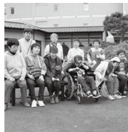
みんなで、集合写真