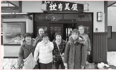
ありがとうございました！

毎年恒例の年末温泉旅行。今年も11月30日～12月1日の日程で、湯川温泉の世寿美屋さんに宿泊して来ました。今年の注目は何と言っても食事！ゆっくり過ぎてから食事会場に向かうと、目を疑うほどの豪華な食事が！海の幸に山の幸、お腹いっぱい頂きましたが、正直に言うとお腹いっぱいではありませんでした(す