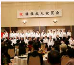
日本一の歌声でお祝いしていただきました