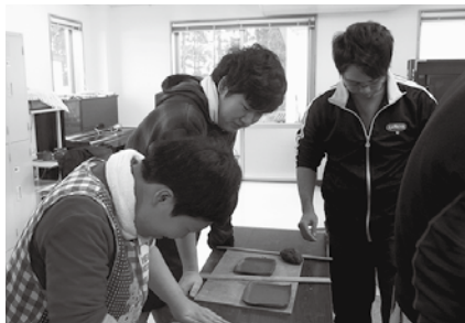
なにをつくろうかな