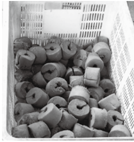
作業前のスポンジ

10月より和賀町岩崎にある花ルンルンさんより受託を受け、レタスの水耕栽培に使用したスポンジに付いた根を取りきれいにする作業を行っています。 根はスポンジに絡まっついて取りづらいこともあります。作業自体は難しくないので、多くの利用者に携わってもらい、安定した品質での納品を目指していきたいと思っています。