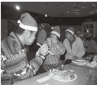
踊ろうか食べようか