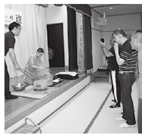
石焼料理に興味津々