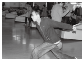
華麗なフォームで