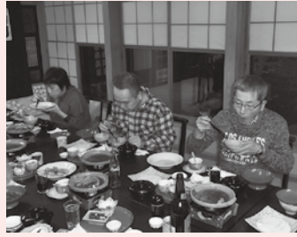
食べきれないほどの豪華料理！

毎年恒例の年末温泉旅行。今年も11月30日～12月1日の日程で、湯川温泉の世寿美屋さんに宿泊して来ました。今年の注目は何と言っても食事！ゆっくり過ぎてから食事会場に向かうと、目を疑うほどの豪華な食事が！海の幸に山の幸、お腹いっぱい頂きましたが、正直に言うとお腹いっぱいではありませんでした(す