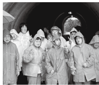
遊覧船乗り場前にて