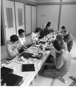
まったりのんびり

昨年は、若くして癌で亡くなった方、神経の一部損傷により身体機能が低下した方、骨折した方、熱中症になった方、一晩中外を歩き続けた方、離職した方等本当にいろいろなことがありました。つい「元気で事故なく、平穩に」と思っています。それでも入居者が痛い辛い、不安な思いをしないようにと、先手先手を打つて必要以上にガードする事は基本間違いで、またガードしきれぬものでもありません。 今年も一生きているからこそを支援する、愛の泉です。