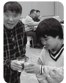
1年お疲れ様でした