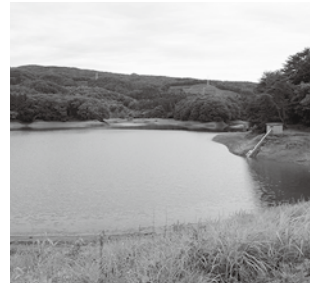
このため池が決壊したら...