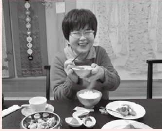
ほっぺたが落ちる～♡