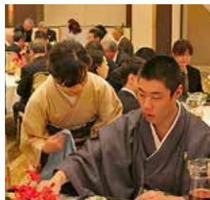
笑顔あふれる和やかな成人祝賀会でした