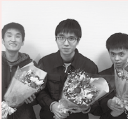
みなさんの活躍を期待しています