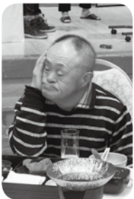
ちょっと酔っ払ったかな

12月7日(土)、渡り温泉別邸楓にて、クリスマス忘年会が行われました。到着後、お風呂に入る人、お部屋でのんびりくつろぐ人と、各々疲れを癒し、リラックスしていました。お昼近くになり、お腹も空いて喉も乾いてきた頃、お待ちかね宴会のスタートです。乾杯の合図と共に、豪華御膳をもりもりと食べ、ノンアルコールビールにジュースをぐびぐび飲みながら、1年の労をねぎらいました。お腹が満たされた所で、今年も工夫を凝らした余興や、18番揃いのカラオケで大いに盛り上がり、あっという間にお開きとなりました。2019年を締めくくるのにふさわしい会となったのではないのでしょうか。2020年もまた良い1年になりますように。