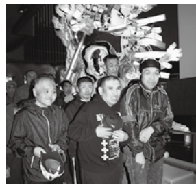
迫力満点な立佞武多の前で