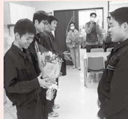
おめでとうございます！