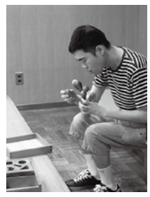
僕は科学をしています