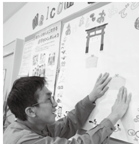
願いが叶いますように

1月6日の仕事始めの日、お正月レクを開催しました。今年の抱負や願い事を絵馬に書いた後、魚釣りのようにする釣りおみくじ、射的をして楽しく新年をスタートしました。今年も楽しい1年になりますように。