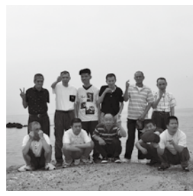
海は広いな大きいな