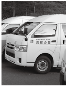
車で移動しました