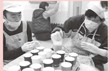
ひとつひとつ心を込めて