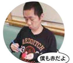
生活科1班 マスコットキャラクター「萩さん」

ざせん草をモチーフにした生活科1班のマスコットキャラクター「萩さん」です。座禅を組んで萩の江の皆さんの安全について願っています。 (知也)