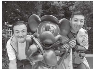
思い出のディズニー旅行