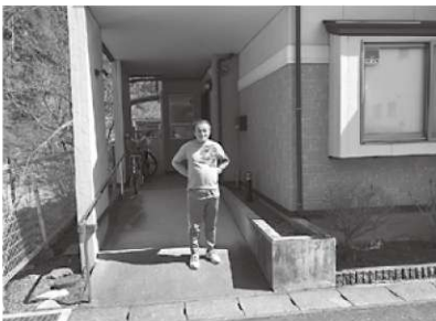
釜石での新居です！

中学を卒業してすぐ、北上市の萩の江学園に入りまして。38年間通して何よりもお世話になりました。 初めて入所して数年間は、逆切れしては周りの人を傷つけてしまったこと。皆と笑ったりして楽しかったこと、皆さんと市外県外へ旅行したことを思い出します。 今回、沿岸地域での生活をすることになりました。15歳のころより希望していたことの1つです。うれしいです。 あちらでの抱負は、まだ分かりません。現地は災害復興中でもあり、少しずつ立ち直ろうとしている沿岸地域なので、何ができるか考えていきたいです。 (正義)