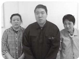
前役員の皆さんお疲れ様でした!!