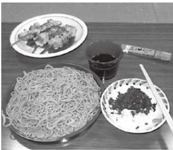
とても美味しくできました