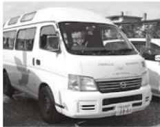
お疲れさまでした