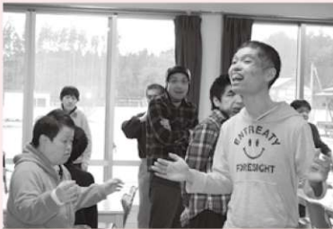
1日の始まりは体操で