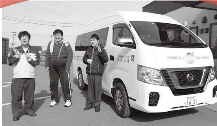
ほくらのキャラバン号

2月20日、かねてより希望していた24時間テレビのチャリティー車を、この度念願叶って寄贈して頂くことができました。新しい車も日産キャラバンで車椅子の利用者を2人乗せることが出来ます。シートの座り心地も満点です。未永く、皆で大切に乗りたいと思います。 (真樹)