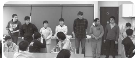
例年になく激戦でした!!