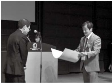
仕事ぶりを表彰されたことも

んだことは他の入居者の支援に活かしていきますね。今までありがとうございます。 (巧)