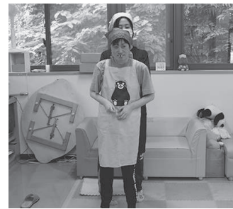
ショップの店員さんみたい♡

8月7日に調理実習を行いました。花巻清風支援学校の実習期間内であるため、当初は実習生と一緒に行う予定でしたが、8月初めに北上市で新型コロナウイルス感染者が発生したため実習は延期となりました。 ホットプレートでホットケーキを焼き、紙カップに入るくらい大きさに切りました。それをカップの底に敷いて好みのフルーツやホイップクリーム、チョコソースなどを盛付けて完成しました。 (英樹)