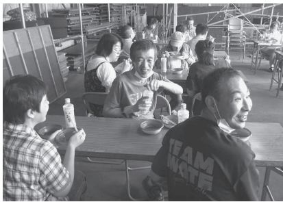
もうすぐ焼けるかなー

7月25日、萩の江の車庫でバーベキューを行いました。天気はあいにくの雨でしたが、屋根の下で気にすることなく楽しんで行うことができました。肉や野菜に焼きそば、最後にはアイスクリームも食べることができて、皆さんとても喜んでいました。