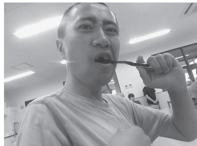
バッチリ磨いてサッパリ！