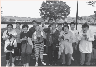
いっぱいお土産頂きました！

9月22日、毎年恒例になりつつある、花巻市大迫町の藤原ぶどう園（早池峰観光ぶどう園）でのぶどう狩り。今年も入居者・支援員の計16名で行ってきました。