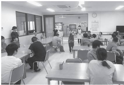
真剣に聞いています！