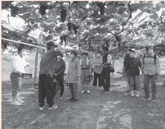
ぶどうが鈴なり より取り見取り