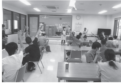
正しく磨けている人ー！