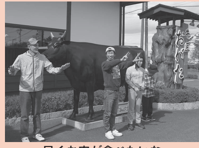
早くお肉が食べたいな