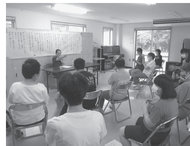
この手話わかりますか？