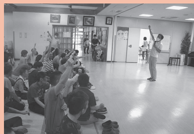
コロナに負けないぞ!