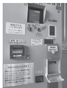
蓋の開閉の取りやめ