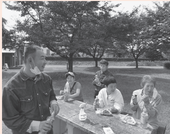
おにぎりも別腹です

9月22日、毎年恒例になりつつある、花巻市大迫町の藤原ぶどう園（早池峰観光ぶどう園）でのぶどう狩り。今年も入居者・支援員の計16名で行ってきました。