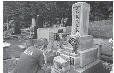
心を込めてお掃除 花を供えてお祈り「また来年も来ますね」