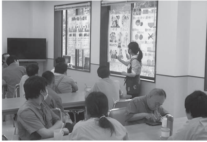
むし歯の原因を考えよう！