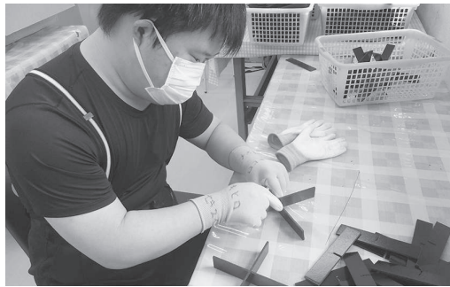
積水化成品の作業です！

北萩寮の受注作業では、障がい程度の関係なく携われる作業（イノアツクのロート削り、積水化成品の弁当組み仕切り）から東北小旗、石川産業の段ボールの貼り・組み立て、桤屋デカルのシールやステッカーの計数から包装までの作業等に取り組んでいます。