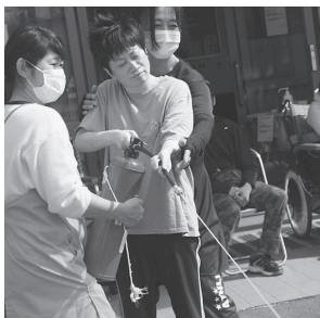
(消火だけど)ファイヤー！

9月24日に、調理室からの出火を想定して、避難訓練を行いました。 13時過ぎに非常ベルが鳴り、避難を促す館内放送を聞いてから避難を開始しました。職員の誘導に従って、走ることなく渋滞することもなく、集合場所に整列することができました。 このあと、消火訓練も行いました。穏やかな天気の下、順番に標的に向けて次々と放水をしました。こちらは笑顔が見受けられる訓練でした。 (英樹)