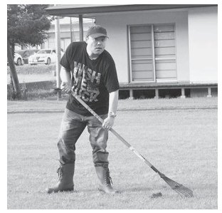
萩の江を綺麗にします。