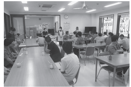
よろしくお願いします！