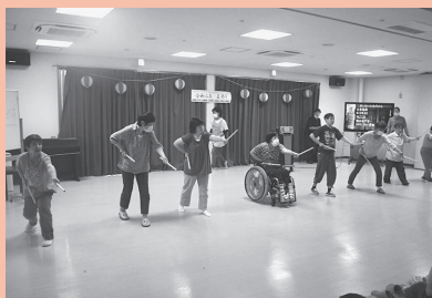
ふるさと太鼓を踊りました