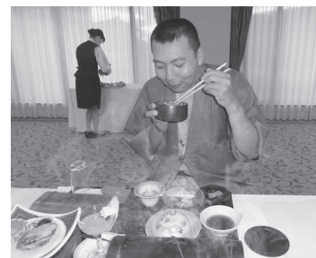
ほかほか湯気おいしそう

宿泊したホテル紫苑は、コロナ休業明けということもあり、感染防止の取り組みをしていますが、ホームでも同じように感染対策をしているので、皆さんスムーズに行うことができました。「密」を防ぐために宿泊客の人数を制限していたのか、かなりのんびりとした雰囲気の中で温泉を楽しむことができました。食事も感染防止をしながらも、美味しく頂くことができました。2日目は、盛岡とは正反對の狛鼻溪で舟下りをし、清流弁当に舌鼓を打ちました。コロナが収まったらもつと遠くに行きたいですね。(柏葉)