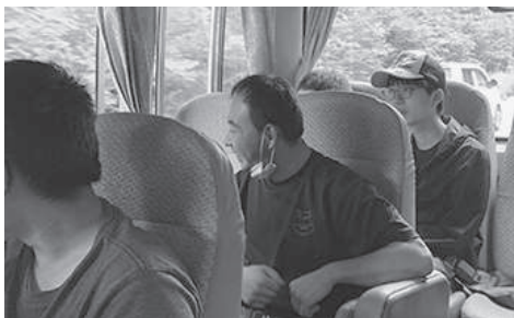
すぎの樹はどんな所かな？