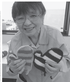
こななかたちのも編んでいます☆