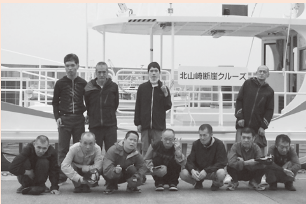
誇りをかけて、乗る。(船に)