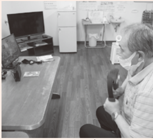
握る腕にも力が入ります