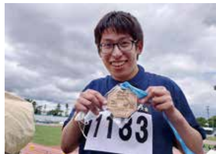
僕もメダル獲ったよ!