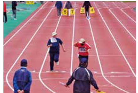
私も負けてられない!