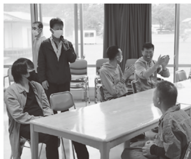
兄のスピーチを静かに聴きます