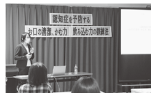
今後に活かします

出前講座 2022.6.24 認知症を予防する ～お口の清潔、かむ力、 飲み込む力の訓練法～