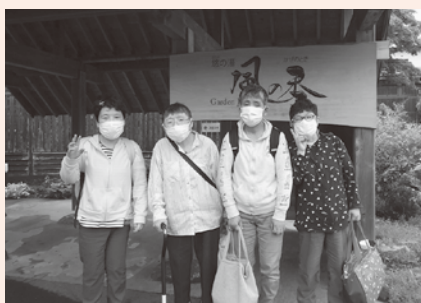
待ちに待ち続けた温泉旅行!