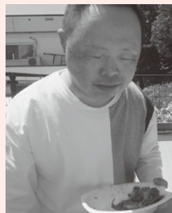
なんも...言えねえ(美味すぎ)