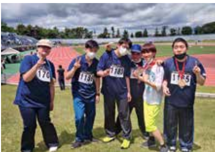
みんなでピース! 頑張ったよ!