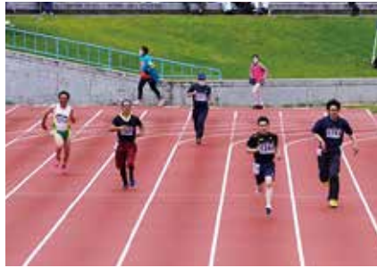
練習の成果見せるよ!