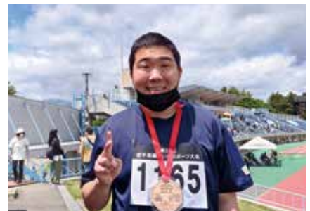
金メダルはもらった!!

編集後記 最近のマイブームは、果物を食べた後に、その種などを植えてみることに。パイナップルにアボカド、マンゴーやライチetc. 何で寒さに弱いのか、ばかり植えるかなと苦笑しつつ、暑さに負けず寒さに負けずコロナにも負けず、元気に育てと水やりする毎日です。 (トクメ)