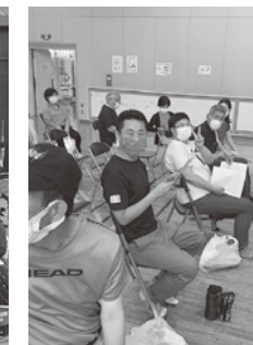
どんな踊りが見れるか楽しみ!