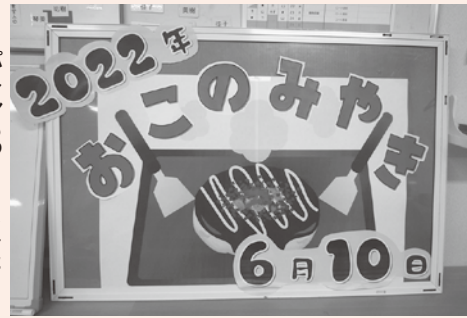
パネルもつくりました