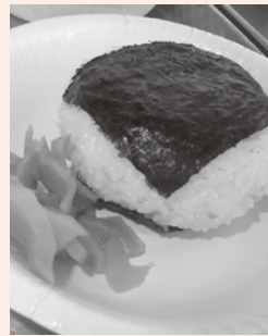
おにぎりも大きい!