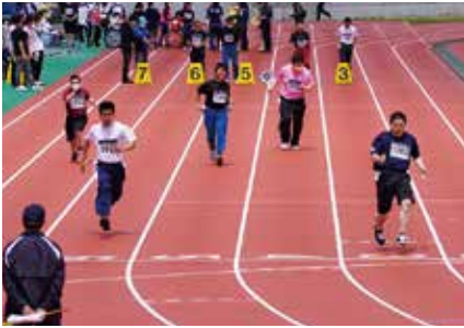
おっしゃ! ぶっちぎりだぜ!!