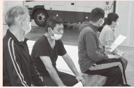
緊張の待ち時間（ドキドキ…）

今年の胃がん検診は「愛の泉特別日程」を北上市に設定して頂き、6月14日の早朝、hokkooにて総勢20名で検査を受けてきました。