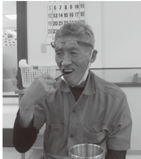
ここが磨きづらいんだよね～