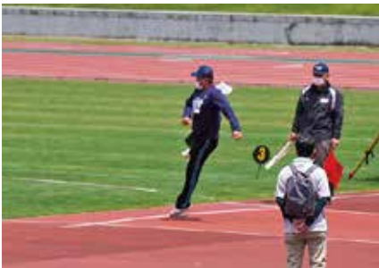
渾身の一球よ届け!