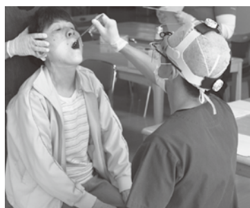
大きく口を開けて!