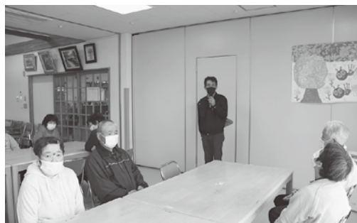
お集まりいただきありがとうございます