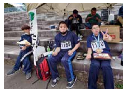
頑張った後のご飯は美味しいね!

6月4日(土)、盛岡市県営運動公園にて第24回岩手県障がい者スポーツ大会が開催されました。当日は天候にも恵まれ、絶好の競技日となりました。当日は皆さん全力で競技に取り組み、銀メダルを次々と獲得していました。 (晃嘉)