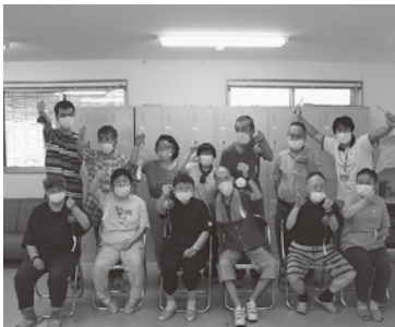
上手に出来ました!

7月3日に青少年の家出前講座で風鈴の絵付けを行いました。始めは難しく感じる方もいましたが、ユーモアある講師の方で、皆さん楽しんで絵付けを行っていました。絵を描いたり、カラフルに塗る方や、色を混ぜて塗る方もいて、それぞれ、個性豊かな風鈴になりました。完成後、風鈴の音を鳴らし、風情を感じていました。 （大久保）