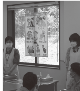
よろしくお願いします!