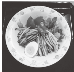
こちらは冷やし中華