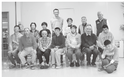
また元気にお会いしましょう