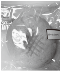
夏の富良野メロンパン