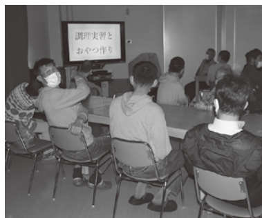
この後、わたし映ります