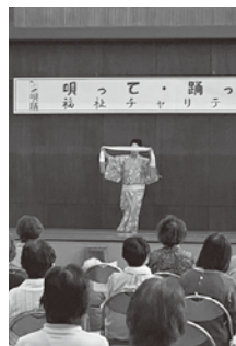
流れるような所作にうっとり...