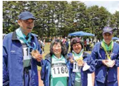
ベストを尽くしました!