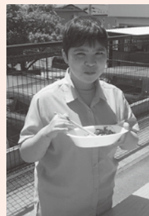
お気に入り焼そば!