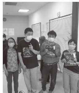
大切に使用させていただきます!

保護者会から「今後のイベントに使用してほしい」という思いを込めて、ポロシャツのプレゼントがありました。ありがとうございました。