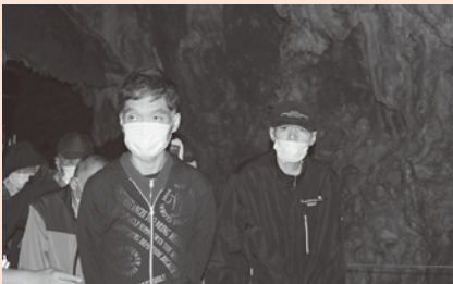
洞窟突入しまーす