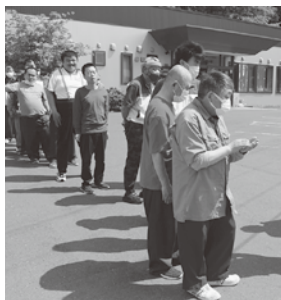
「もっと早くできますよ」