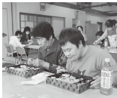
楽しい時間を母と一緒に