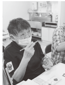
完成をイメージ中

7月3日に青少年の家出前講座で風鈴の絵付けを行いました。始めは難しく感じる方もいましたが、ユーモアある講師の方で、皆さん楽しんで絵付けを行っていました。絵を描いたり、カラフルに塗る方や、色を混ぜて塗る方もいて、それぞれ、個性豊かな風鈴になりました。完成後、風鈴の音を鳴らし、風情を感じていました。 （大久保）