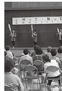
民謡とのコラボも!