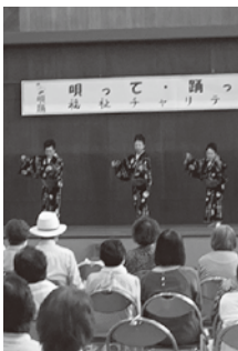
力強い踊りも見応えあり!