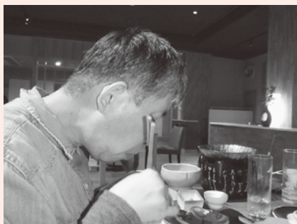
食べる時は黙食で