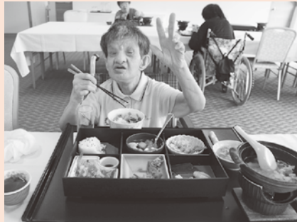
豪華な昼食をいただきます

5月26日、生活科2班と製作科合同の日帰り旅行で、花巻市の愛隣館に行きました。 温泉や食事を心から満喫した様子で、参加した利用者からは「また行きたい」との声が聞かれました。