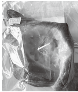
シャインマスカットデニッシュ