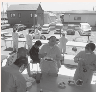
やっぱり皆で食べるに限る!