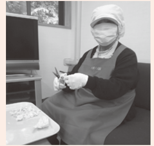
キャベツをチヨキチヨキ