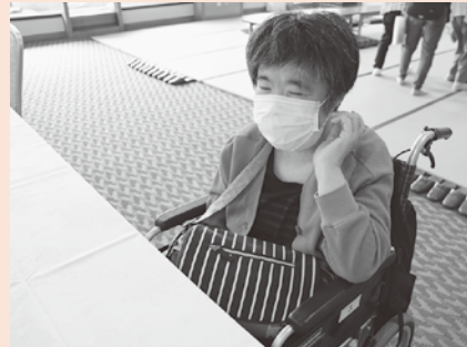
温泉に入って温まりました