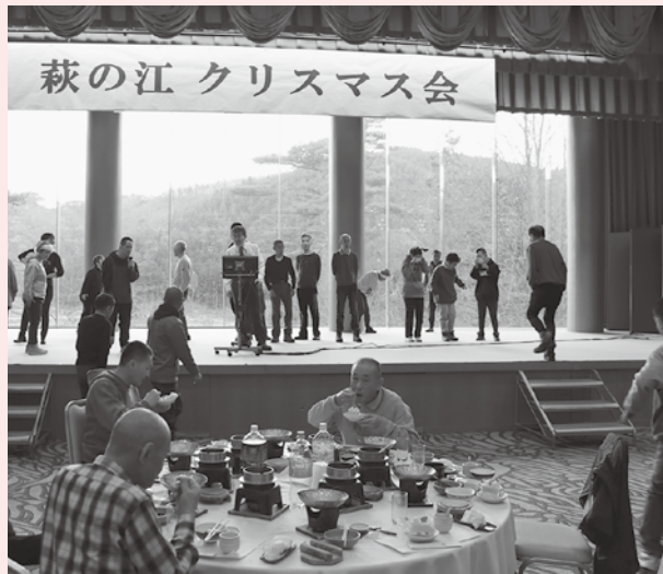
クリスマスケーキを食べて宴もたけなわ