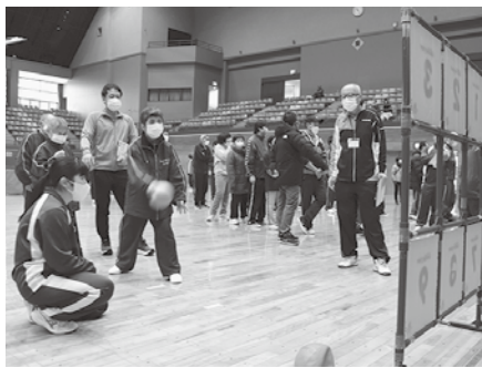
的に当たればいいな

11月25日に北上総合体育館でふれあいスポーツ大会が行われました。参加者は様々な競技に汗を流しています。(翔)