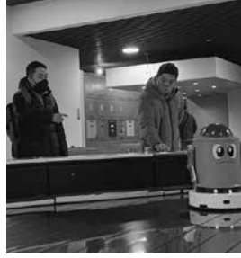
赤いロボット こっちだよ～!