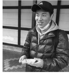
寒い時の団子も 悪くないね!

12月2日、毎年恒例の日帰り旅行に行ってきました! 心待ちにされていた利用者の方も多く、「行先はどこだろう?」「お土産何買おうかな」と想像を膨らませていました。