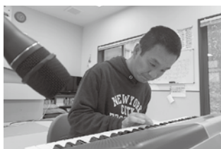
得意のピアノを 披露するよ!