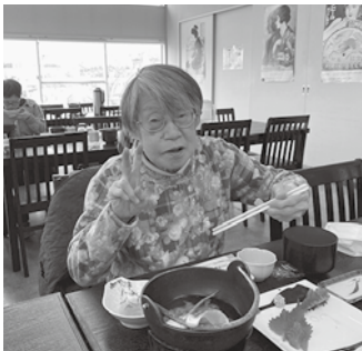
お刺身美味しいね