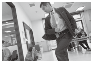
華麗なターンが 決まったぜ!