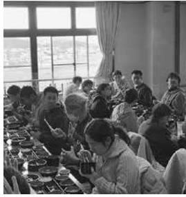
お腹すいた～! いただきます!