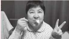
年越しのお寿司おいしい~! ~ホームでのんびり過ごす方~