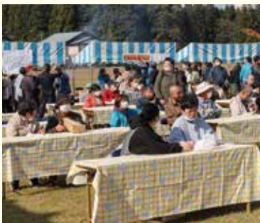
たくさんの観客と模擬店