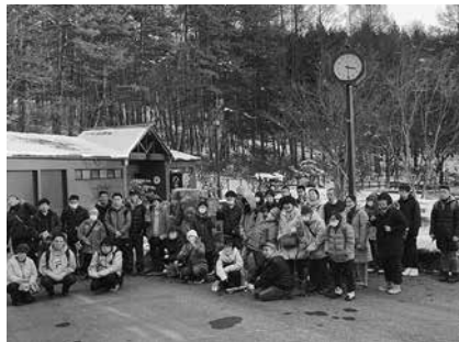
最後はみんなでピース!