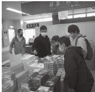
どれにしようかな~?