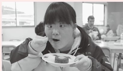
クリームが美味しいね