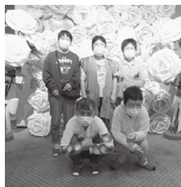
10月10日 花巻温泉1泊旅行満喫!!