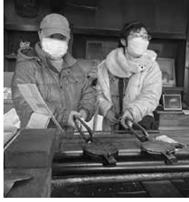
せんべい焼きに挑戦!