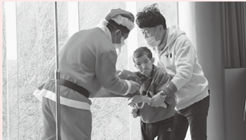
寒い国からのプレゼント

12月14日に渡り温泉でクリスマス忘年会が行われました。食事や温泉を堪能し、1年の疲れを癒しました。(ほのか)