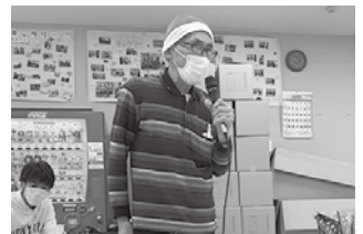
クリスマスといえば サンタでしょ!