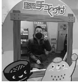
手づくり村来たよ～!