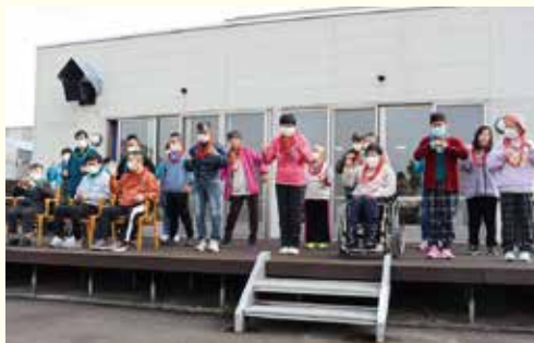
日頃の成果を披露します