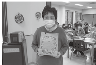
私もビンゴの商品 もらえたよ!