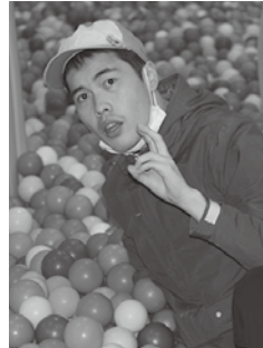
ボールプール楽しい♪