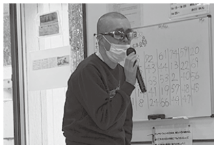
サングラス いい感じ?