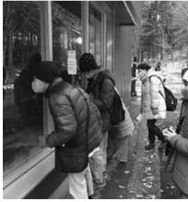
ここには 何の動物いるかな～?