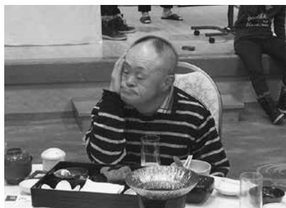
ビールが大好きでした…