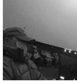
プラネタリウム どんな感じかな～?