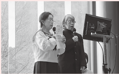
「高校三年生」に扮して