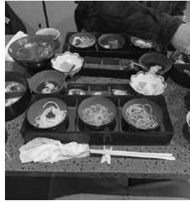
今年は三大麺が主役!