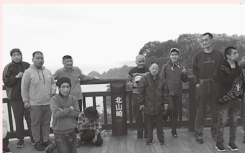
怖いから振り向いちゃダメ!