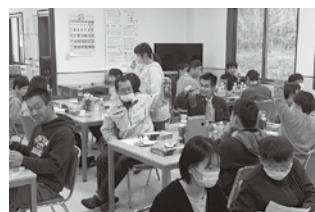
待ちに待ったご飯! かんぱ〜い!