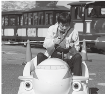
どちらに行こうかなー