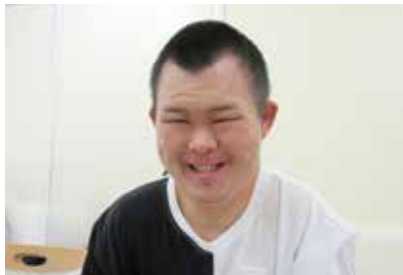
これからも素敵な笑顔で よろしくお願いします!

また、新しい後援会活動の模索を進めながら、障がい者の幸せのため、支援してまいります。