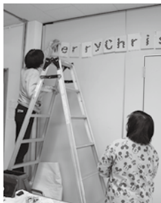
さよならクリスマス

楽しいクリスマス会が終わり、少し寂しさを覚えながらも後片付け。イオン江釣子店様が来設し、みんなと一緒にクリスマスしましょう。片付けが終わった後には、ちぎり絵のお手伝いをしていただきました。(幅)