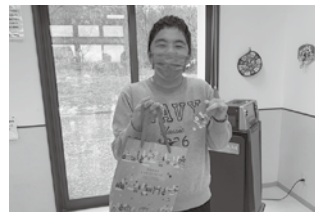
ビンゴの商品 ゲットだぜ!