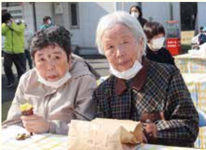
家族と秋の味覚に舌鼓