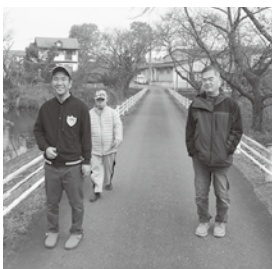
11月の休日 もみじ寮周辺の散策

11月22日北上駅前内科クリニック様にご協力頂き、15名の入居者が7回目の新型コロナウイルスワクチン接種を行いました。(関山)